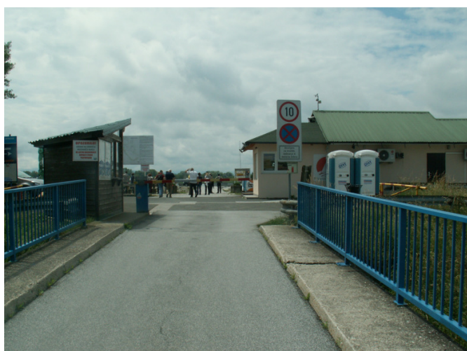
Vhod na Ptujsko jezero