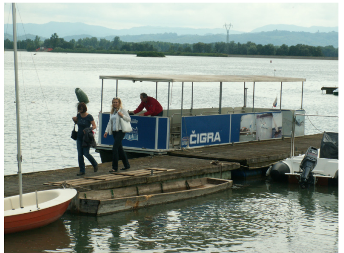
Z ladijco Čigra smo si ogledali jezero z vodne strani